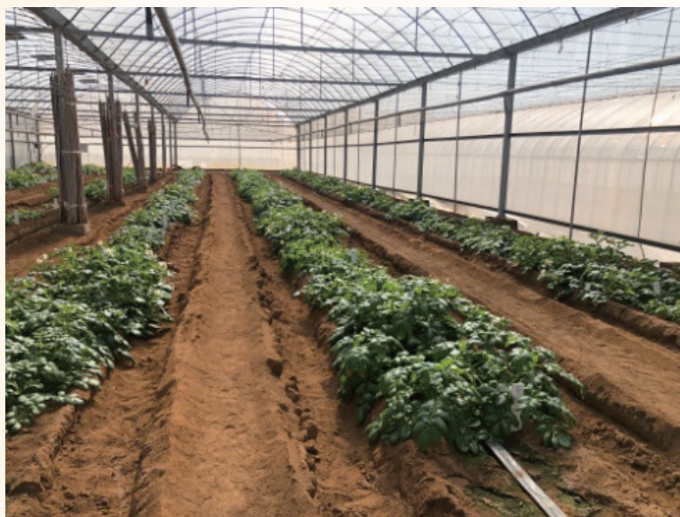
圖 3. 本場執行建立馬鈴薯耐旱生產調適管理技術計畫，進行噴灌節水試驗情形

Jaerla)、兩個中早生品種(Krostar Eersteling、Claustar Bintje)及兩個中晚生品種(Nicola、Desiree)進行耐旱試驗，以3種供水處理方式(人工灌溉、雨水供應和乾旱逆境)，觀察不同品種間對於乾旱逆境與慣行栽培間的差別，發現葉數及株高表現受乾旱缺水影響明顯。在乾旱影響下，株高與產量塊莖表現正相關，初步推測株高或許可作為區分乾旱耐受性的性狀參考，做為耐逆境品種表現的初步指標，提供產業與研究人員參考。此外，透過各類耐旱生育指標建立，未來除可針對進行現有品種篩選評估，更可透過與乾旱逆境有關的表徵，間接選拔具耐旱表現的品種，以提高選育成效。