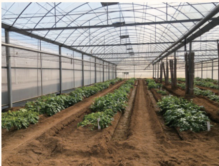
圖 2. 本場執行建立馬鈴薯耐旱生產調適管理技術計畫，進行溝灌節水試驗情形

學者 Deblonde 及 Ledent (2001) 指出爲能建立馬鈴薯耐旱評估的生育指標，在比利時試驗區以兩個早生品種 (Eersteling、