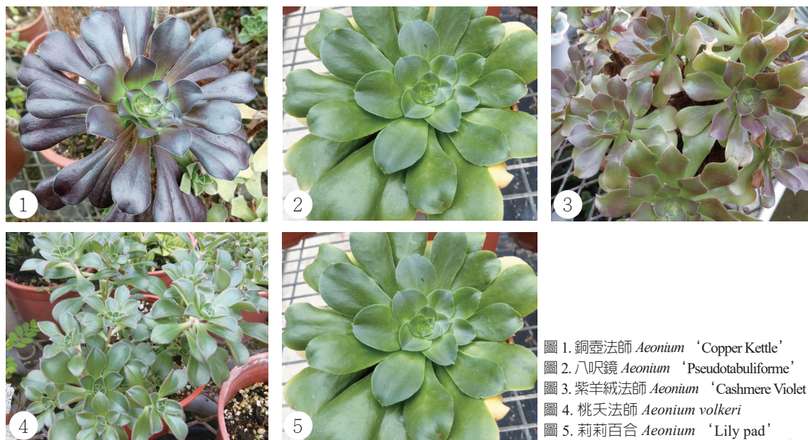
圖 1. 銅壺法師 Aeonium ‘Copper Kettle’ 圖 2. 八呎鏡 Aeonium ‘Pseudotabuliforme’ 圖 3. 紫羊絨法師 Aeonium ‘Cashmere Violet’ 圖 4. 桃夭法師 Aeonium volkeri 圖 5. 莉莉百合 Aeonium ‘Lily pad’

莉莉百合是一小型栽培種，其外型與多數 Aeonium 屬植物比較不同，它具有肥厚的葉片，反而比較像是擬石蓮屬 ( Echeveria 屬) 俗稱石蓮類的成員，肥厚的葉片和玫瑰花狀的外型十分討喜，其植株與古奇亞 ( Aeonium goochiae ) 一樣具有線毛，也具有特殊的氣味，莉莉百合也是容易長側芽，會長成小樹型的種類，夏季沒有明顯休眠，容易栽培。