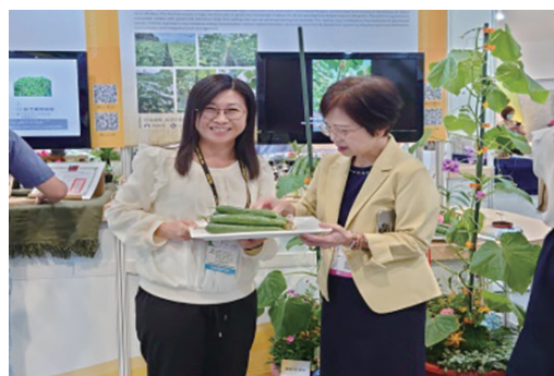
圖 9-5、2023 年臺灣創新技術博覽會，以「一種石斛萃取物用於製備促進淚液分泌正常化之組合物的用途」獲得國內發明競賽展區銅牌獎