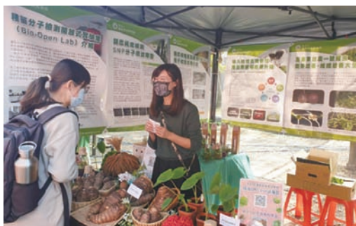
圖 9-4、第二十七屆種苗節慶祝大會暨農業成果展，本場展出同仁向參展民眾解說展項內容與合影