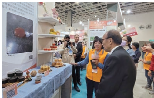
圖 9-3、2023 臺灣醫療科技展，本場同仁向陳次長添壽與參展來賓解說展項內容