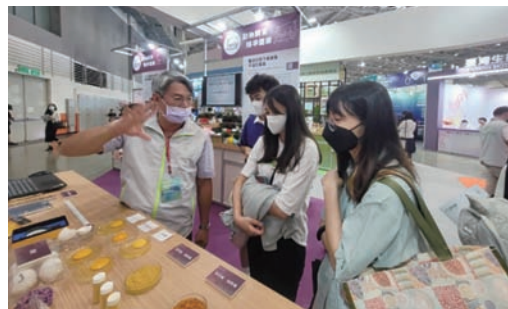
圖 9-6、2023 年亞洲生技大展，本場同仁向陳代理部長及現場民眾介紹農業副產物加值應用與花卉品種辨識系統