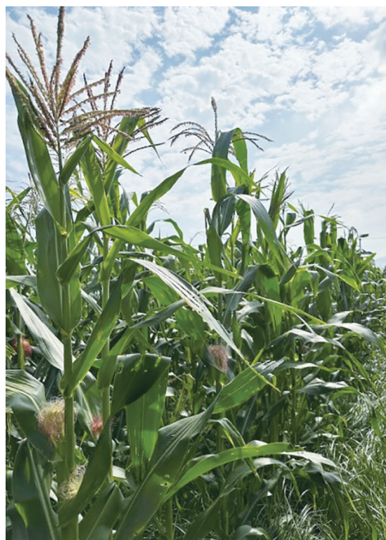
圖 1. 有機食用玉米（臺南白）植株

（表一、圖2）。植株高遭遇強風容易造成倒伏現象，因此，栽培過程在中耕時必須作好培土作業，以利防止玉米在管理過程之倒伏情形。另外，臺南白玉米穗位高，適合機械採收。