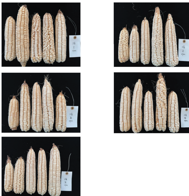
圖 2. 食用玉米穗型調查