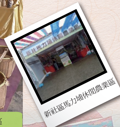
新社馬力埔休閒農業區