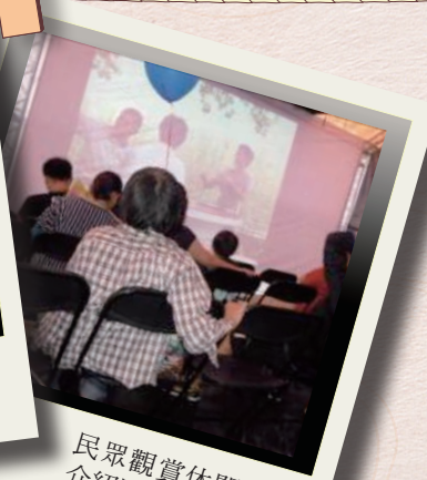
民眾觀賞休閒農業介紹影片