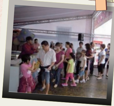
民眾排隊領取DIY體驗券