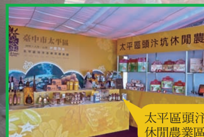
太平區頭汴坑休閒農業區