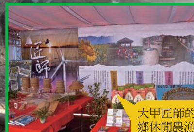
大甲匠師的故鄉休閒農漁區