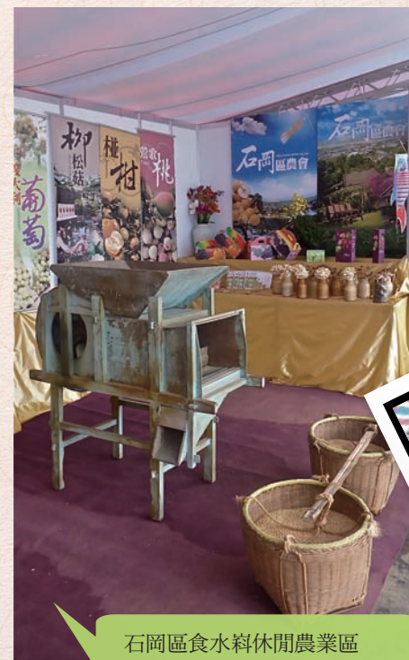
石岡區食水料休閒農業區

5、展覽期間，所有的文宣資料均被索取一空，部份旅遊行程的宣傳DM再加印供民眾索取，顯現此次的資料十分有參考價值，有達到宣導的效果。