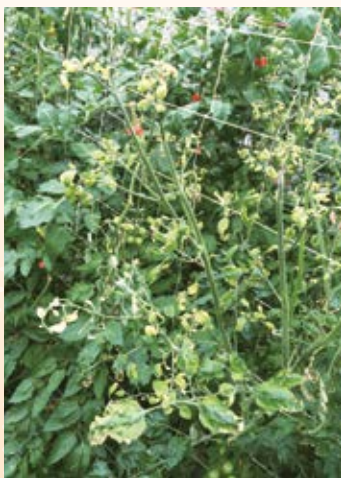
圖3. 番茄罹黃化捲葉病毒病植株病徵

今需具有的品種特性，尤以番茄捲葉病毒病，嚴重肆虐亞熱帶與熱帶地區的番茄生產，若遭感染則植株嚴重矮化，新葉萎黃捲曲、變形(圖3)，罹病植株結果數少，果實品質亦不佳，無商品價值，而傳染番茄黃化捲葉病毒病之媒介昆蟲為銀葉粉蝨，常經由其刺吸式口器危害作物，而間接傳播病毒；目前已知的抗TYLCV之抗性基因有 Ty-1 、 Ty-2 、 Ty-3 、 Ty-4 、 Ty-5 、