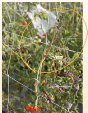
圖5. 番茄罹晚疫病植株水浸狀病徵