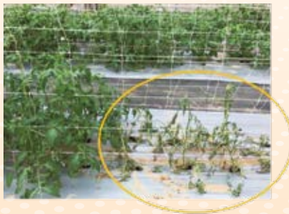
圖4. 番茄罹青枯病植株萎凋病徵