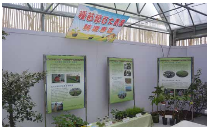
圖 - 在嫁接 DIY 教育區展示本場輔導種苗類百大青農之豐碩成果