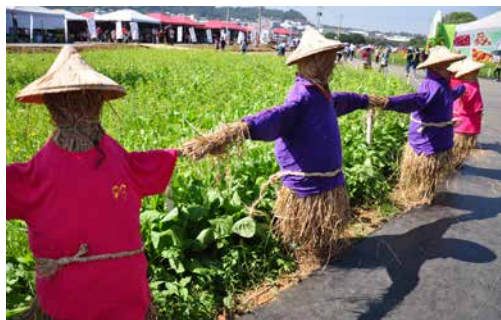
圖 - 稻田的守衛—稻草人