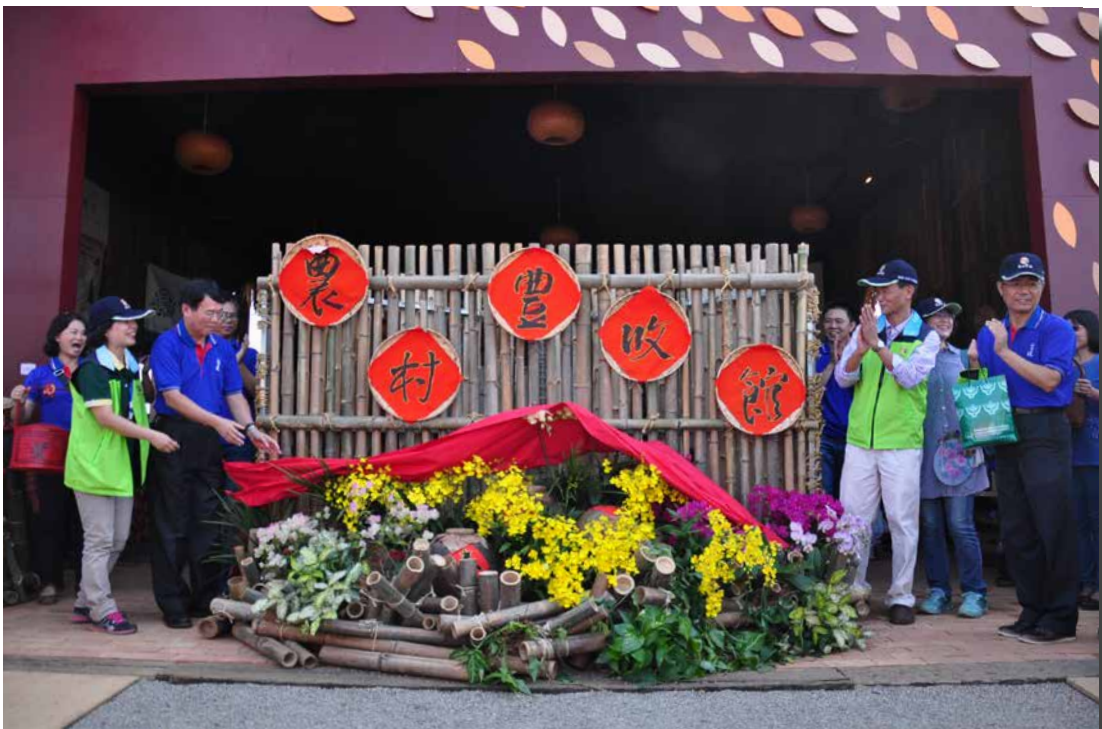
圖 - 開幕活動揭幕儀式

農村豐收館開幕活動特別邀請苗栗泰安士林社區噶囉嘎原民舞蹈團以及臺中市香頌合唱團，為農村豐收館揭開活動序幕，結合農村豐收館主題與造型設計，安排搗麻糬體驗活動（苗栗泰安士林社區）與風鼓車稻穀體驗（臺中神岡溪州社區），並於現場發放平安豐收米贈予現場遊客，水土保持局臺中分局多年來在中苗地區推動農村再生的豐碩成果將在此展現並與民眾分享豐收的喜悅，也期許未來農村的美好能更為大眾所知。