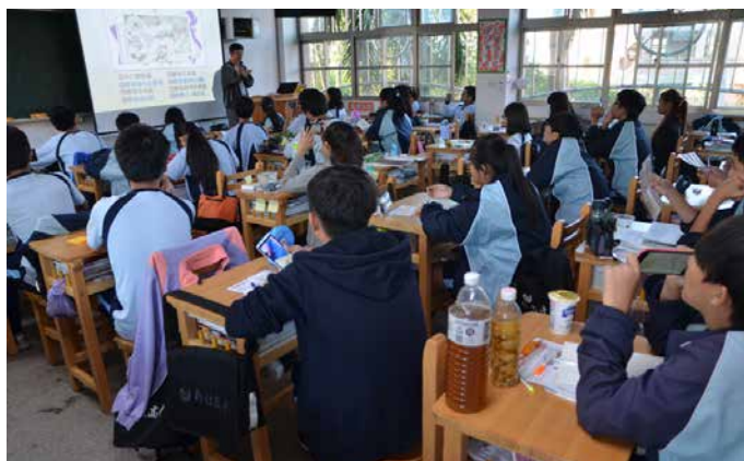
圖 - 嫁接 DIY 教育民眾認真聽講情形

大家是否看過真正柳丁、椪柑、柚、芒果、桃、楊桃、番石榴、四季檸檬、梨、蓮霧、蜜棗果樹，為什麼長出來的果子都一樣那麼甜？口感都一樣那麼好吃？你有沒有想過是甚麼原因？使他們長得都是那麼的相像？是的，其實他們每一株都是來自同一株母樹，利用母樹枝條經過嫁接的方式，嫁接在數以千百計的砧木上，因此果農就能生產出品質一致的大量水果了。