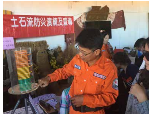
圖 - 土石流防災體驗

每週二上午 9:00 至 12:00 辦理土石流防災演練及宣導活動，由臺中分局規劃課協助安排土石流防災專員到農村豐收館進行土石流防災闖關，藉由闖關方式讓民眾認識土石流形成的原因、製作雨量觀測筒、了解土石流避難方式、緊急救難設備等知識，加強民眾自主防災意識與行動能力。