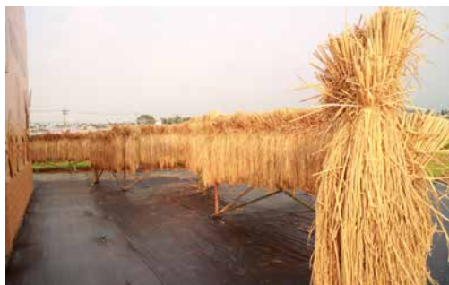
圖 - 倒吊米農村藝術

小時候在操場、田野邊只要空曠的地方都會有跳房子的位置。只要有一根粉筆或者樹枝，就能在地上畫起跳房子遊玩，是美好的農村回憶。在農村豐收後，家長在一旁椅寮休憩，孩童玩「跳房子」遊戲，提供民眾遊戲互動及照相。