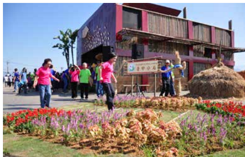
圖 - 古早味跳房子體驗