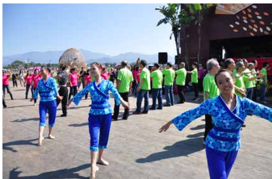
圖 - 臺中市香頌合