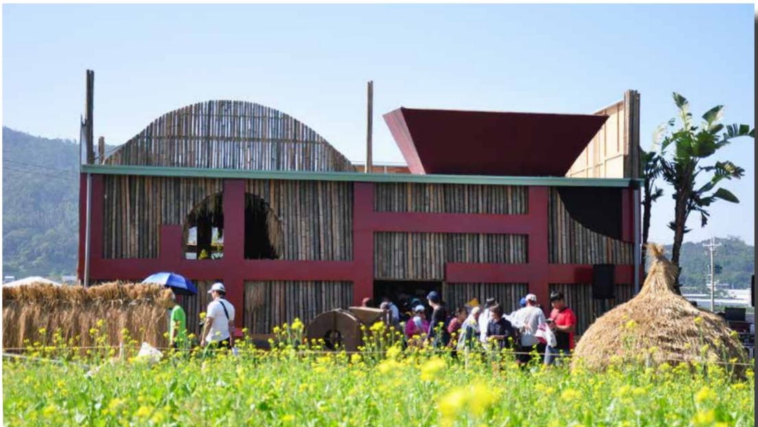
圖 - 展館風鼓造型

農村豐收館除了風鼓車外型，更搭配草埤堆、稻草人、懷舊童玩及「倒吊米」裝置造景，營造人們回憶中的農村豐收場景與互動場域。