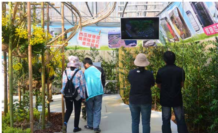
圖 - 參觀民眾專注觀賞本場嫁接技術的成果

本區以圖片及多媒體播放方式，並以竹編方式彷彿回到時光隧道，介紹本場以往進行相關茄科蔬菜作物嫁接成果、嫁接技術的基本知識及展現過去臺灣嫁接技術之豐碩成果，透過此區能讓民眾有初步的嫁接技術認知。