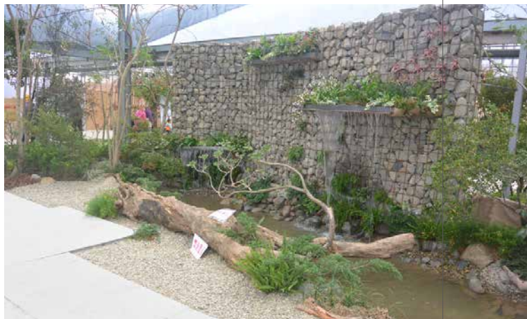
圖 - 充滿放鬆的入口意象區

本區以景石牆及水幕的方式來呈現，並以蕨藤類植物、小型灌木及卵石點綴其中，讓參觀民眾一入館內，彷彿致身潺潺流水的溪谷中，隨心自在地享受那股清涼、放鬆的感覺，讓疲憊的身心得到完全的紓解，好整以暇地迎接一趟知性的「嫁接之旅」。