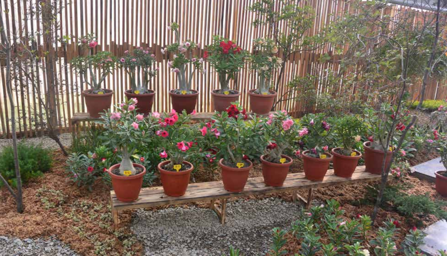
圖 - 沙漠玫瑰不同品種在時尚區秀中展現最亮眼的姿態