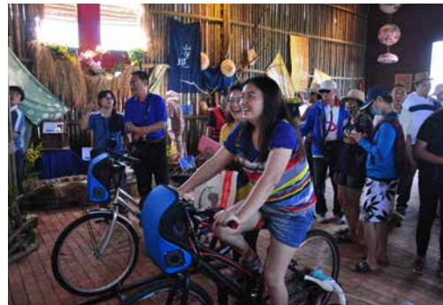
圖 - 虛擬實境體驗

結合虛擬 3D 互動高科技展現農村旅遊體驗。特別聘請專業記者實地走訪農村社區，拍攝輕旅行路線所真實感受到的農村風情與農村社區在地推薦專訪影片。透過民眾踩腳踏車驅動社區旅遊路線影片播放與風扇負離子空氣機送風，使民眾彷彿親自騎乘單車迎風，體驗農村樂活旅行，引起民眾深入農村社區旅遊的興趣。