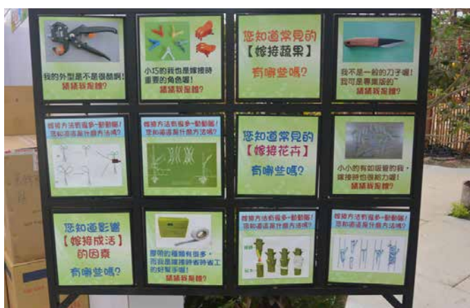
圖 - 翻翻樂讓民眾更深刻的認識嫁接知識