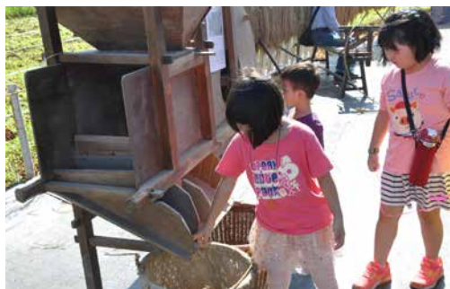
圖 - 風鼓體驗