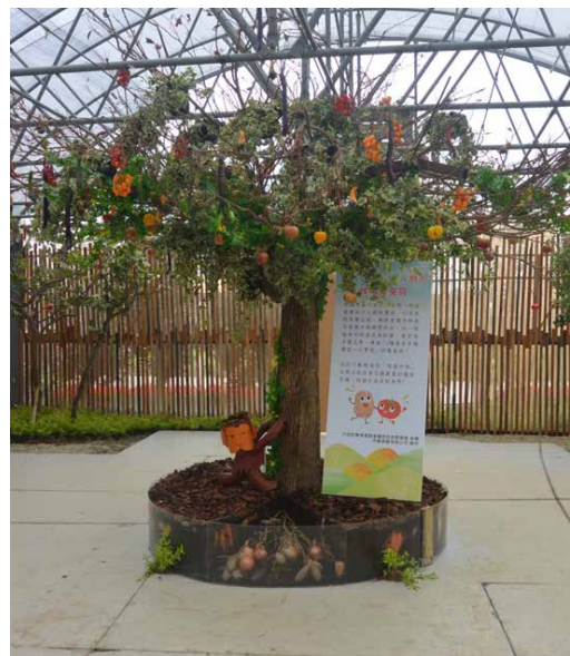
圖 - 未來嫁接的發展夢想

嫁接未來區以未來樹呈現，底部為根莖類作物，上為瓜果類作物，展現嫁接技術未來的可能性，並傳達「多種願望一次實現」之驚喜感。另外大樹代表著生命力強、永不放棄、屹立不搖的精神，象徵著農民及農技人員勤奮不懈，長時間投入嫁接技術的研發，如此不斷精進的「嫁接技術」，改善作物的品質及產量。