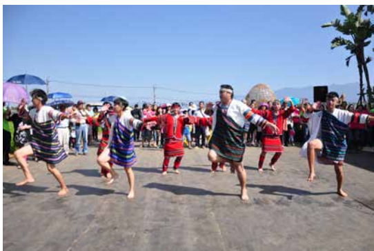
圖 - 士林社區原民舞蹈

萬花筒現場以現代人手一機的手機觀看，只要打開相機功能，貼近觀賞孔，就能體驗到美麗的萬花筒，方便拍照或錄影留下紀念。萬花筒 6 個面稜鏡形狀皆不同，換個角度觀賞會有不同的體驗。