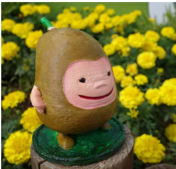
圖 - 3D 列印的馬鈴薯寶寶