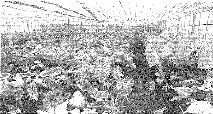
圖2 經由初步篩選出彩葉芋雜交後裔之單株

種苗改良繁殖場於96年7月27日舉行彩葉芋新品系觀摩會並進行票選活動，將已經由初步篩選過之彩葉芋雜交後裔優良單株100盆，植株依照高低順序一字排開，由票選之民眾依據個人的喜好選出心目中最佳的彩葉芋新品系單株。根據票選結果，其中以葉片顏色呈現半透明的粉紅色系單株最受青睞，編號21號廣葉型單株葉片呈現粉紅色半透明並具粉紅色葉脈，葉緣綠色且株高中等的新品系奪冠；第二名為編號7號的矮性狹葉型新品系，其葉色為亮眼的紅色，葉脈紅色並具有綠