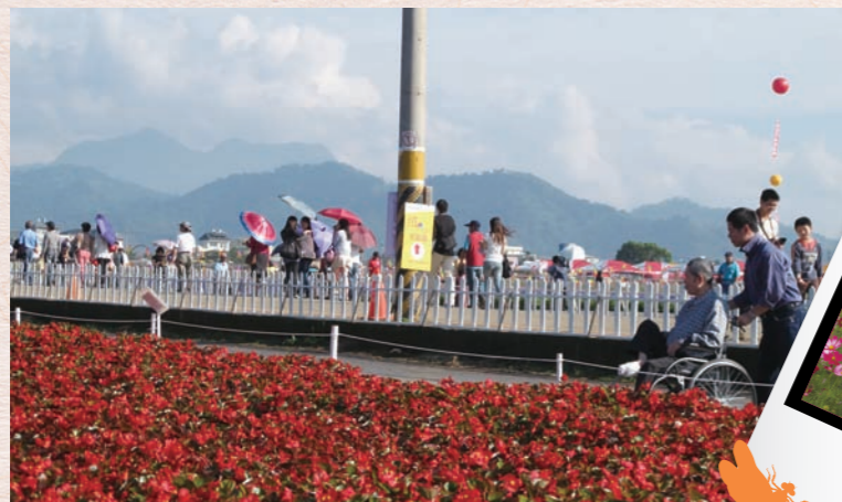
活動組織架構及分工