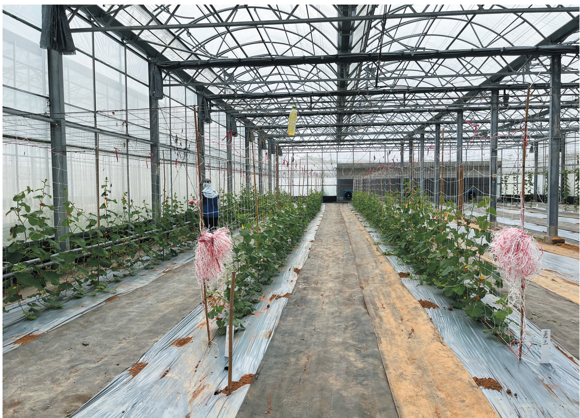
圖 2. 種苗場試驗期間甜瓜栽培情形