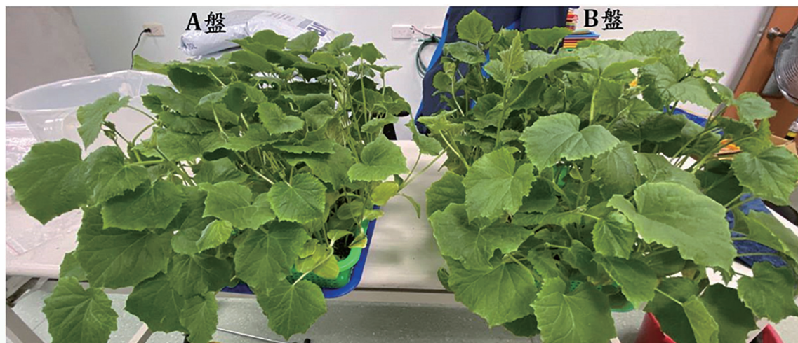
圖 3. 胡瓜種子樣本分別播種 2 盤，子葉及本葉皆未有任何病徵

以 RNase Plant Mini Kit 進行正、負對照樣本核酸萃取，參考國際期刊針對鞘蛋白基因設計之 KGCP-F/KGCP-R 引子對 (Kim et al. 2009) 進行 RT-PCR 反應測試，電泳分析後於 484 bp 處可見增幅條帶即視為陽性判定為檢出。結果顯示僅正對照樣本在預期片段有增幅條帶 (圖 4)。為進一步確認條帶專一性，將 RT-PCR 產物經雙向定序，所得序列 484 bp，在 NCBI 比對後顯示與 2023 年土耳其 Cucurbita pepo 感染 KGMMV (Accession No. OQ915137) 的相似度達最高為 100% (484/484bp) (圖 5)，表示此引子對可專一性辨識 KGMMV，當樣本以 ELISA 呈陽性反應時，可用 RT-PCR 進行雙重確認。