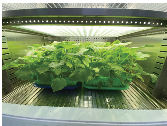
圖 2. 將胡瓜種子樣本播種 2 盤，置於 26°C 生長箱生長育苗

批種子以種子直接研磨或種子 Grow-out 檢測皆未檢出，植株子葉及本葉亦沒任何病徵（圖 3）。在 ISTA 種子病毒檢測規範中提及，DAS-ELISA 檢測法可同時偵測樣本中具感染性與非感染性的病毒顆粒，因此可能導致偽陽性結果，造成病毒傳播率的高估。因此，DAS-ELISA 檢測可作為攜帶病毒種子批